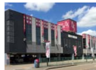
クィーンオブノースランド砺波店