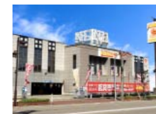
のーすらんど ほっと館 高岡町店