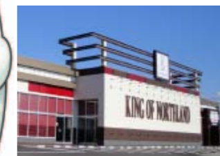
キングオブノースランド黒部店