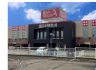
クィーンオブノースランド滑川店