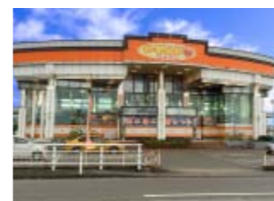
のーすらんど ほっと館 上市店