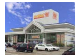
のーすらんど ほっと館 岩瀬店