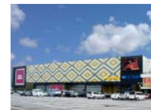
クィーンオブノースランド佐野店