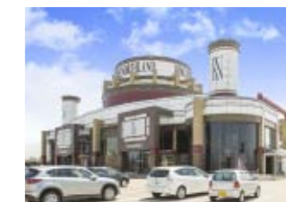
キングオブノースランド魚津店