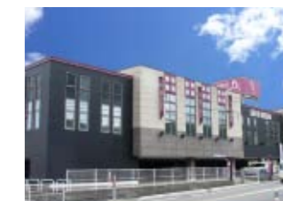
クィーンオブノースランド呉羽店