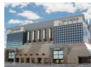
キングオブノースランド富山店