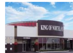
キングオブノースランド吉久店