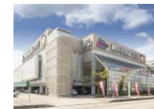
ノースランド2001山室店